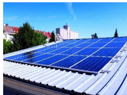
OIE na vrtiću