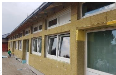
Energetska obnova osnovne škole