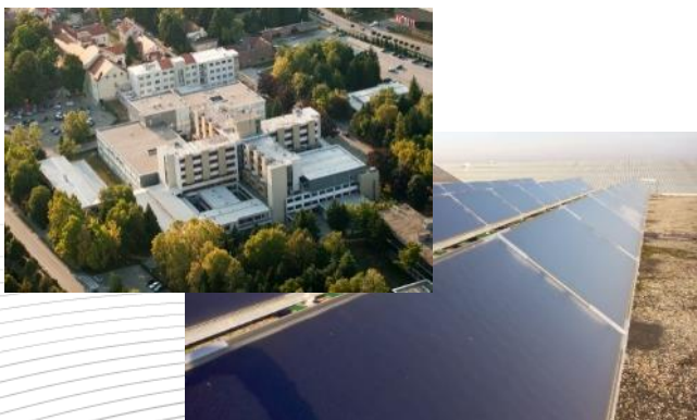
Opća bolnica Koprivnica